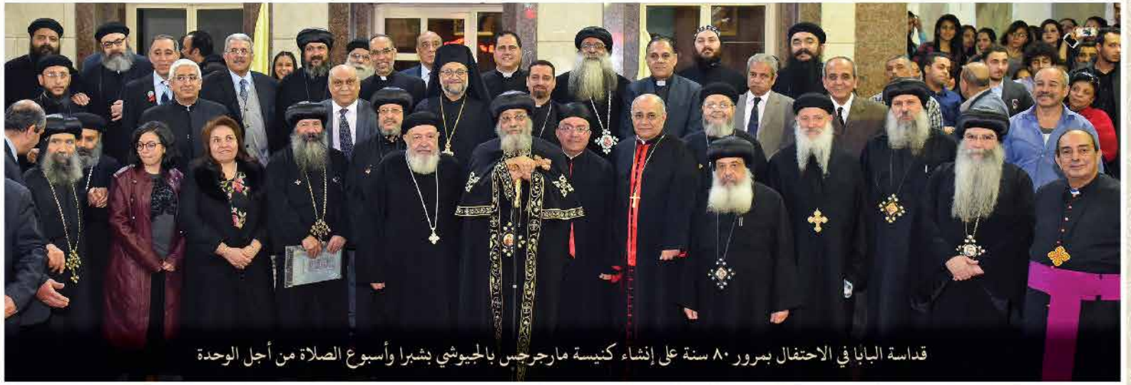
قداسة البابا في الاحتفال بمرور ٨٠ سنة على إنشاء كنيسة مارجرجس بالحيوشي بشبرا وأُسبوع الصلاة من أجل الوحدة