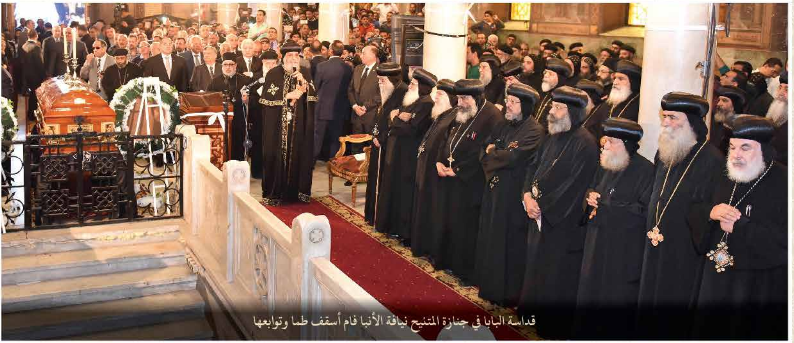
قداسة البابا في جنازة المنتح نيافة الأنبا فام أسقف طما وتوابعها