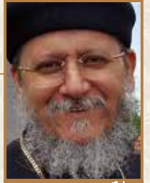
القسيس يوحنا الضيف كنيسة السيدة العذراء شيبانغو