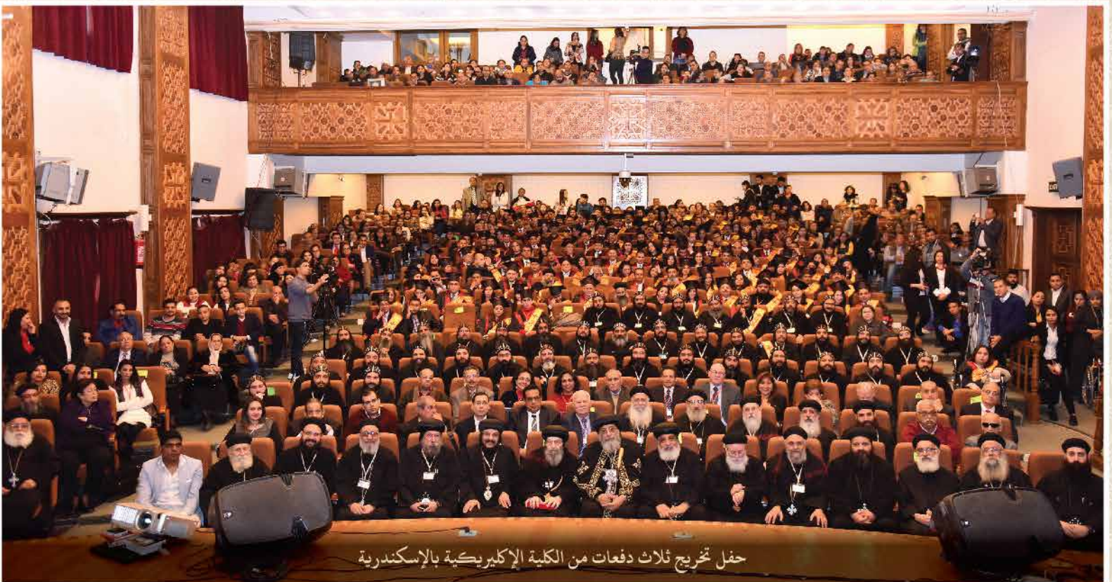
حفل تخرج ثلاث دفعات من الكلية الإكليريكية بالإسكندرية