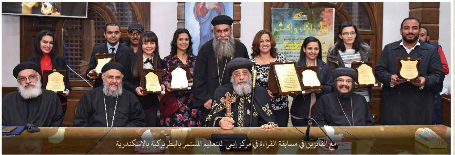
مع الفائزين في مسابقة القراءة في مركز إيمي للتعليم المستمر بالبطريركية بالإسكندرية