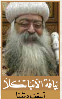
نيافة الأنبا نكلا أسقف دشنا

(٣) الذي له عينين تريان الحق ولا تشهدان له، يدعي بالباطل على الناس، لا يعترف بما رآه، وينشر ما لا يراه.