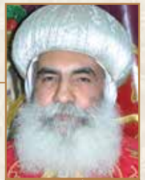
زيارة الأنبا يامين طران المنوفية

ولم يسمح الأب لابن أن يقول: «اجعلني كأحد أجراك»، بل قال أبني هذا كان ميتاً فعاش وكان ضالاً فوجد إنه مشهد مفرح لعودة الابن البعيد إلى أبيه وأحضانه..