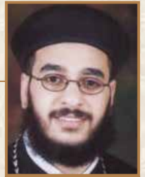
القسيس القبطي القديس حنا كنيسة السيدة العذراء الشيبانغو