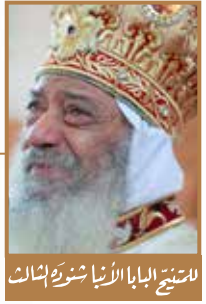
للمنح البابا الأناثورة الثالث