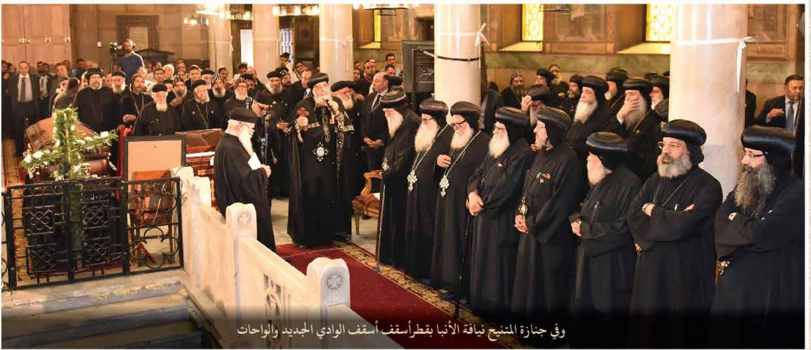
وفي جنازة المنتح نيافة الأنبا بقطرأسقف أسقف الوادي الجديد والوحدات