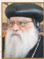
بشارة الربا بالشمس لجانة هجرية وطابع ومسال اطفيل

في إيماننا الأرثوذكسي، نحتاج أن نفهم ونعي العديد من الإيمانيات، ببساطة وعمق في نفس الوقت. فالبعض قد يظن أننا يجب أن نحيا فقط بالإيمان البسيط دون فهم، إلا أن أمانتنا تجاه كنيستنا هو أن نفهم إيماننا ونحفظه، ونعيش به. فالبعض يظن أنه يكفي ان نمارس العبادة بحب لله دون أن نفهم تفاصيل إيماننا وعقيدتنا، لكن الكتاب يعلمنا ان نحفظ وديعة الإيمان كما تسلمناها. لذلك أحب أن أكلّمكم اليوم عن أحد المفاهيم الإيمانية الهامة..