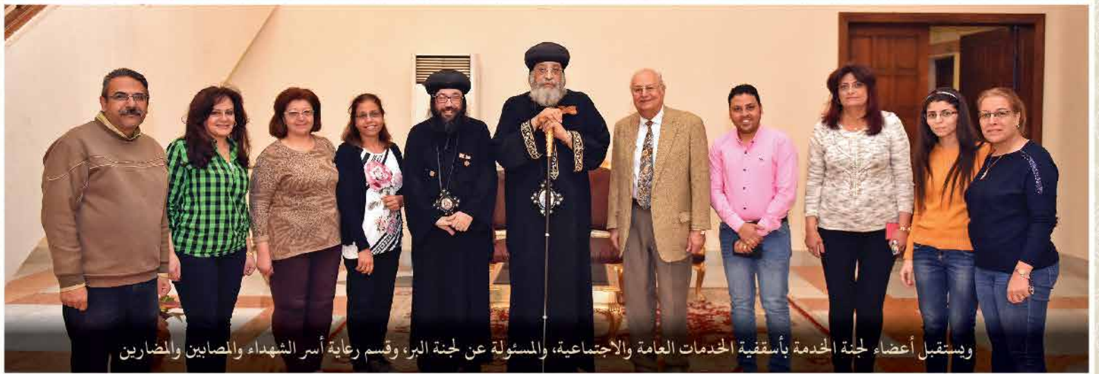
ويستقبل أعضاء لجنة الخدمة بأسقفية الخدمات العامة والاجتماعية، والمسئولة عن لجنة البر، وقسم رعاية أسر الشهداء والمصابين والمضارين