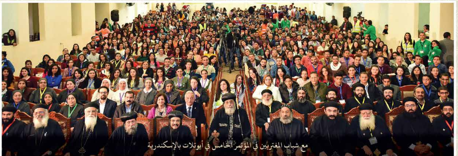
مع شباب المغتربين في المؤتمر الخامس في أبوتلات بالإسكندرية