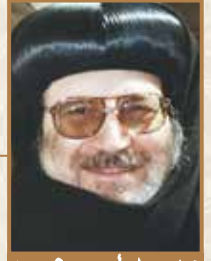
زيارة (الربنا يسوع) طران كنز الشيخ ريويلد ليري