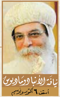
نيافة الأنبا وماريون أسقف ٦ أكتوبر وأوسم