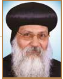
نيافة البابا إسحاق أسقف ورئيس دير أبرتا

من جنسه مات وأوصى له بمالٍ كثيرٍ جداً. فلما علم القديسُ بذلك همَّ بتمزيقِ الوصية، فوقع جسرمانوس على قدميه وطلب إليه ألا يمزقها وإلا فرأسه عَوْضاً. فقال له القديسُ: «أنا قد متُّ منذ زمانٍ، وذاك مات أيضاً». وبذلك صرفه ولم يأخذ منه ولا فلساً واحداً [بستان الرهبان قول (١١٥)].